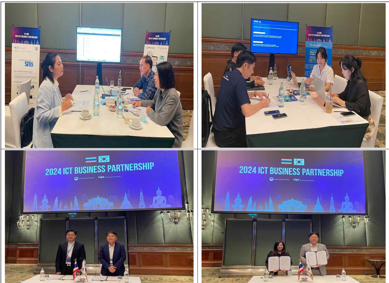
< 한-태국 ICT 비즈니스 파트너십 개최 >